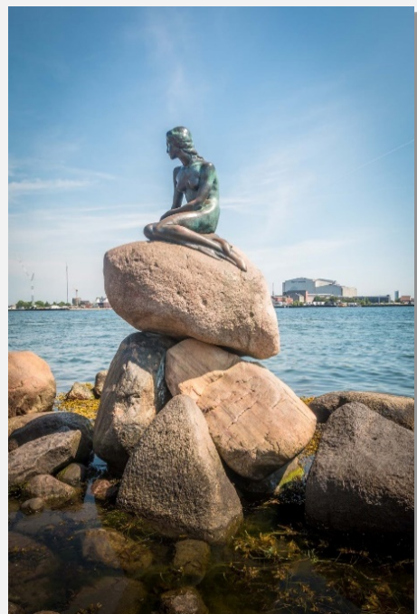
Μικρή Γοργόνα, Κοπεγχάγη