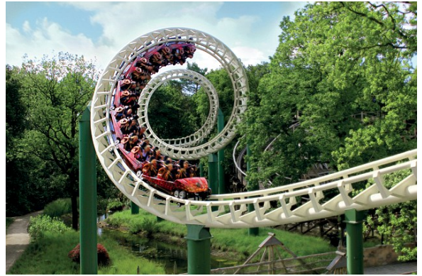
Raveleijn , ταξιδέψτε με το ονειρικό Dreamflight

Επιστροφή στο ξενοδοχείο αργά το απόγευμα.