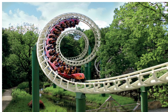
Raveleijn , ταξιδέψτε με το ονειρικό Dreamflight

Επιστροφή στο ξενοδοχείο αργά το απόγευμα.