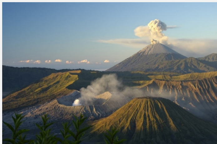
Μπαλί - Ηφαιστειο Κινταμάνι