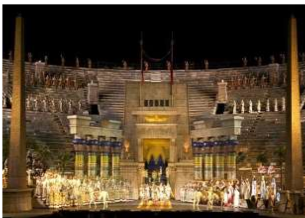
Όπερα Aida στο θέατρο Arena

* Τα εισιτήρια για την 101 η διοργάνωση του Φεστιβάλ Όπερας Arena di Verona είναι ήδη διαθέσιμα! Οι τιμές κυμαίνονται από €26 έως €108 στις κερκίδες και από €137 έως €270 στην αρένα (πλατεία).