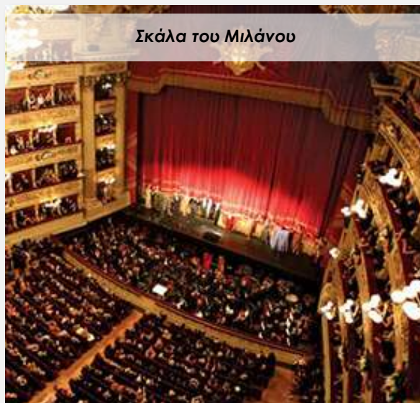
Σκάλα του Μιλάνου

Το Versus επισημαίνει την ανάγκη έγκαιρης εκδήλωσης ενδιαφέροντος για τις παραστάσεις, ώστε να εξασφαλιστεί η διαθεσιμότητα εισιτηρίων.