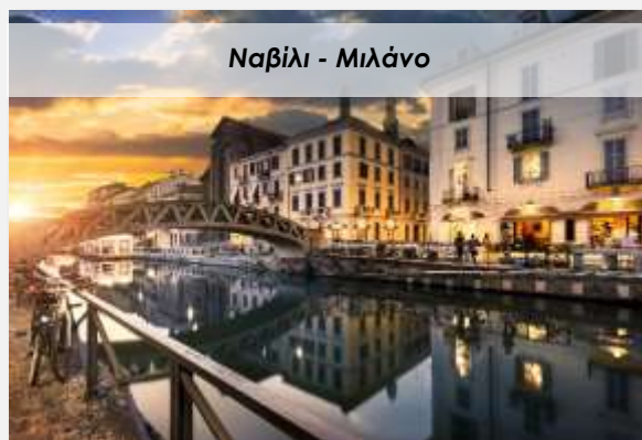
Ναβίλι - Μιλάνο