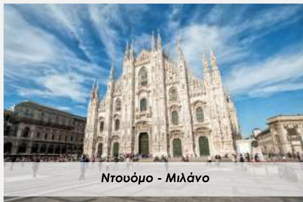
Ντουόμο - Μιλάνο

Προτείνουμε επίσης ανεπιφύλακτα μια βόλτα με βαπορέτο στη λίμνη, για να θαυμάσουμε το καταπράσινο λοφώδες ειδυλλιακό τοπίο, τις υπέροχες