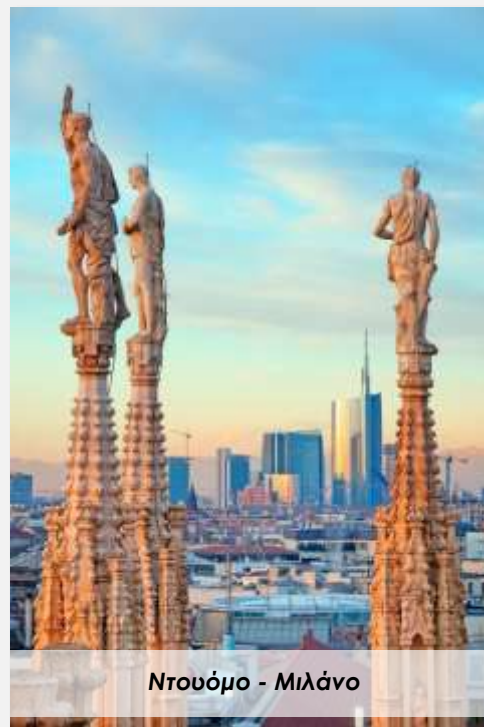
Ντούμο - Μιλάνο

Το μεσημέρι αναχώρηση για τη Βερόνα, κάνοντας μια σύντομη στάση στο όμορφο Μπέργκαμο . Θα απολαύσουμε έναν ευχάριστο περίπατο στο κέντρο της