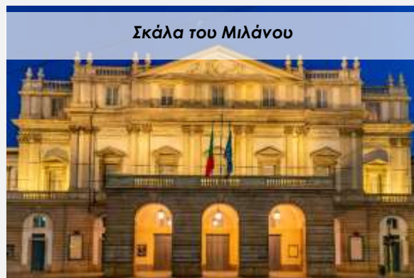
Σκάλα του Μιλάνου