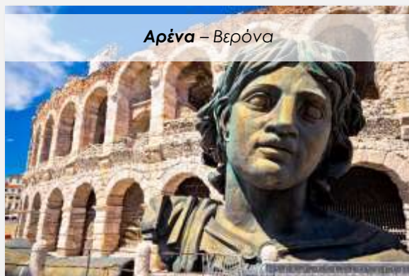
Αρένα – Βερόνα

Το παραπάνω πρόγραμμα είναι ενδεικτικό. Η σειρά των εκδρομών/ξεναγήσεων ενδέχεται να αλλάξει αν κριθεί αναγκαίο, για την καλύτερη εκτέλεση του προγράμματος, χωρίς ωστόσο να παραλειφθεί καμία από τις επισκέψεις που περιγράφονται. Το τελικό ενημερωτικό αποστέλλεται περίπου 3-5 ημέρες πριν από την εκάστοτε αναχώρηση.