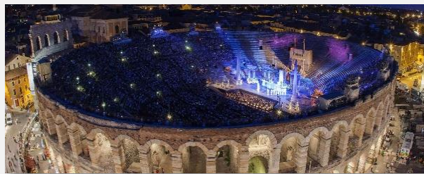
Αρένα της Βερόνα