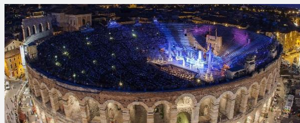
Αρένα της Βερόνα