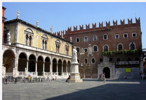
Πλατεία Dei Signori