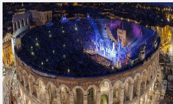
Αρένα της Βερόνα