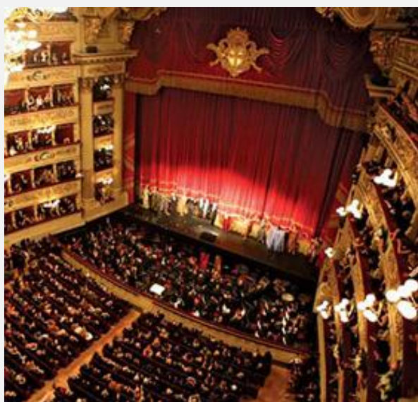
Σκάλα του Μιλάνου