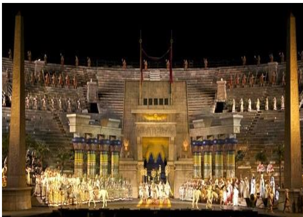
Όπερα Aida στο θέατρο Arena