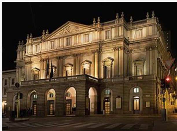
Σκάλα του Μιλάνου

Ολοήμερη εκδρομή στη Βενετία, την πόλη των Δόγηδων με τα 118 νησάκια, τα 160 κανάλια και τις 400 γέφυρες, την πατρίδα του Καζανόβα και του Μάρκο Πόλο. Θα έχουμε την ευκαιρία στην περιπατητική μας ξενάγηση να δούμε μερικά από τα πιο γνωστά αξιοθέατα της πόλης όπως την πλατεία του Αγίου Μάρκου όπου βρίσκεται η ομώνυμη βασιλική, το παλάτι των Δόγηδων, τη γέφυρα των στεναγμών και τον πύργο του ρολογιού. Στον ελεύθερο χρόνο το περίφημο Café Florian και η