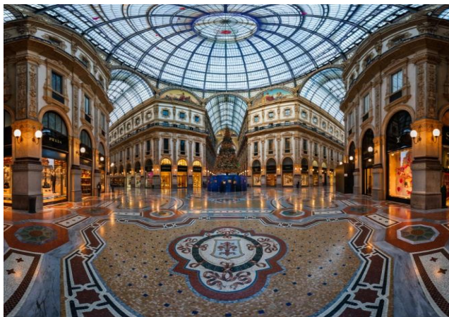
Η περίφημη Γκαλερία Βιτόριο Εμανουέλε, το παλαιότερο εμπορικό κέντρο στον κόσμο!