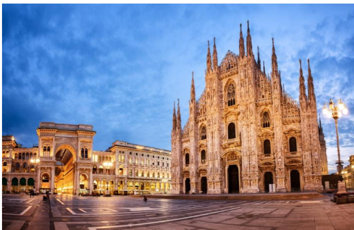
Ο καθεδρικός του Μιλάνου στην πλατεία Ντουόμο είναι ο 2ος παγκοσμίως μεγαλύτερος γοθτικός ναός, μετά τον αντίστοιχο της Σεβίλλης.