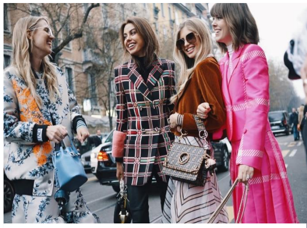
Το Μιλάνο είναι μια μητρόπολη της μόδας. Δύο φορές τον χρόνο διοργανώνεται εκεί η Εβδομάδα Μόδας στην οποία οι σημαντικότεροι ιταλικοί οίκοι παρουσιάζουν τις κολεξιόν τους. Τότε ολόκληρη η πόλη ζει στους ρυθμούς της μόδας.