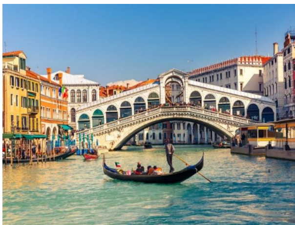
Η περίφημη Γέφυρα Ριάλτο, στη Βενετία

Ορόσημο αποτελεί η πλατεία Σαν Μάρκο με τον ομώνυμο καθεδρικό. Εκεί βρίσκεται και το ιστορικό καφέ Florian, που άνοιξε το 1720 και είναι το παλαιότερο στον κόσμο. Στην ίδια πλατεία βρίσκεται και το Θρυλικό Παλάτι των Δόγηδων, το οποίο είχε και τμήμα που λειτουργούσε ως φυλακή και χώρος βασανιστηρίων. Στους χώρους υποδοχής του παλατιού δεσπόζουν έργα του Τισιανού και του Τιντορέτο. Η Βενετία τον Σεπτέμβριο γίνεται η πόλη των σταρ, λόγω του μεγάλου κινηματογραφικού φεστιβάλ της. Οι εκδηλώσεις του φεστιβάλ λαμβάνουν χώρα στο νησάκι Lido όπου πηγαίνει κανείς με καραβάκι. Στο Lido υπάρχει το ξενοδοχείο Des Bains, στο οποίο έγιναν τα γυρίσματα της ταινίας «Θάνατος στη Βενετία» (1971) που βασίζεται στο ομώνυμο μυθιστόρημα του Τόμας Μαν. Κάθε δύο χρόνια, στην πόλη της Βενετίας και συγκεκριμένα στους Κήπους και στο πρώην ναυπηγείο Αρσενάλε, διοργανώνεται η περίφημη Μπιενάλε. Τότε συγκεντρώνονται στην περιοχή όλοι οι μεγάλοι συλλέκτες του κόσμου και πλήθη φιλότεχνων. Η τέχνη στη Βενετία είναι μια ισχυρή ατραξιόν. Μουσεία υπάρχουν πολλά και περπατώντας μπορείτε να τα βρείτε όλα. Ένα μουσείο που ξεχωρίζει όμως είναι το Γκούγκενχάϊμ, το οποίο στεγάζεται στη βίλα της αμερικανο-εβραίας θρυλικής συλλέκτριας Πέγκι Γκούγκενχάϊμ. Εκεί εκτίθεται η περίφημη συλλογή της με όλους τους σπουδαίους μοντερνιστές – από Πικάσο μέχρι Πόλοκ.