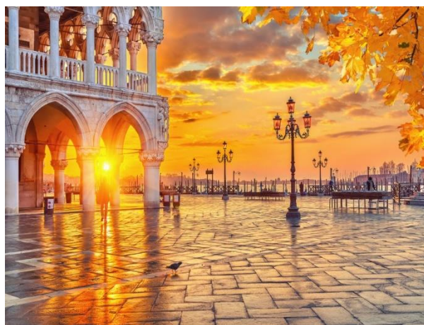
Η πλατεία Σαν Μάρκο το απόγευμα. Αυτή είναι η καλύτερη ώρα για να απολαύσετε ένα aperitif στο καφέ Florian