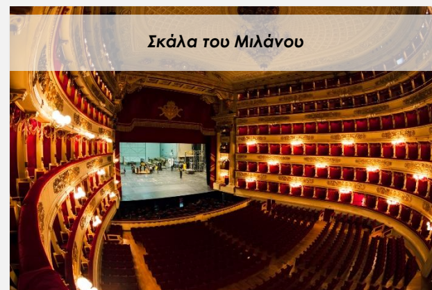
Σκάλα του Μιλάνου