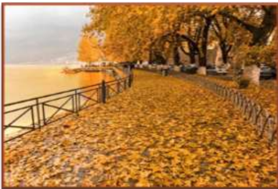
Η υπέροχη λίμνη των Ιωαννίνων