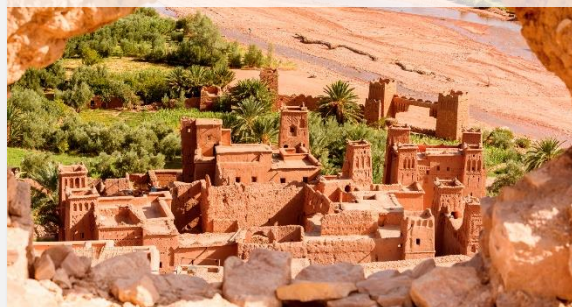
Αϊτ Μπεν Χαντού

Την αποκάλεσαν «η αυτοκράτειρα των πόλεων». Σήμερα δεν έχουν αλλάξει πάρα πολλά πράγματα στη Φεζ. Αν εξαιρέσει κανείς πως γύρω από το ιστορικό κέντρο έχει απλωθεί μία σύγχρονη πόλη, η Φεζ είναι η καρδιά του Μαρόκου, το πολιτιστικό και θρησκευτικό του κέντρο. Κατά τη διάρκεια της σημερινής ξενάγησής μας θα δούμε τη Μεντίνα, που από το 1981 έχει χαρακτηριστεί από την ΟΥΝΕΣΚΟ Μνημείο Παγκόσμιας Πολιτιστικής Κληρονομιάς και που μαζί με τη Δαμασκό, το Κάιρο και το Μαρακές, είναι από τις παλαιότερες μεσαιωνικές πόλεις του αραβικού κόσμου. Εδώ θα γνωρίσουμε το Τέμενος Καραουίν, το πρώτο ισλαμικό πανεπιστήμιο