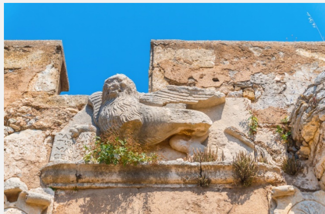
Κάστρο στο Μυλοπόταμο