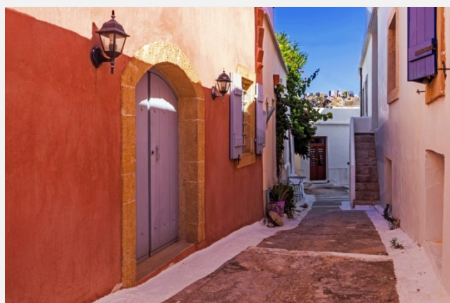
Παραδοσιακό σοκάκι στα Κύθηρα