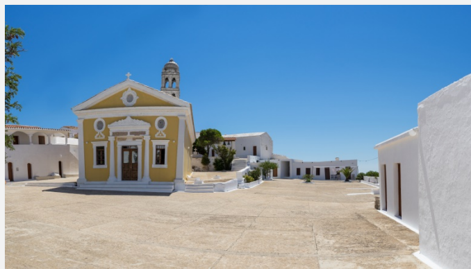
Αγία Μονή Κυθήρων

Διπλανή θέση στο πούλμαν κενή, εκτός αν είστε οικογένεια.