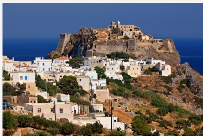
Χώρα Κυθήρων με ενετικό κάστρο