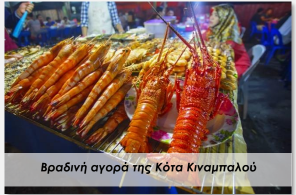
Βραδινή αγορά της Κότα Κιναμπαλού

Το τέλειο φυσικό σκηνικό για να κάνουμε κατά βούληση άνετες βόλτες μέσα στη ζούγκλα, να χαλαρώσουμε στην παραλία, να καταδυθούμε στα λαχταριστά νερά και να θαυμάσουμε εκπληκτικά κοράλλια και πολύχρωμα ψάρια. Κι αφού τα κάνουμε όλα αυτά και γεμίσουμε τις μπαταρίες μας, θα απολαύσουμε ένα αξέχαστο πικνίκ παραθιν' αλός.