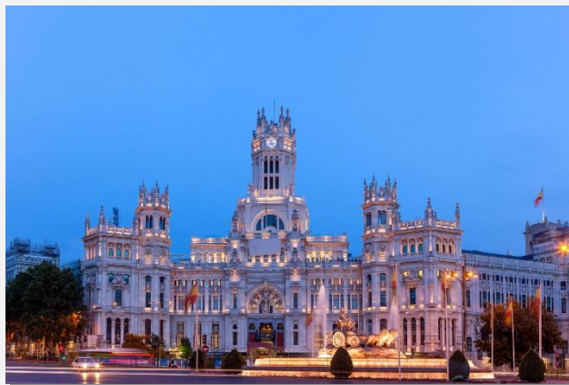
Μαδρίτη – Πλάθα Θιμπέλες

Πρωινή αναχώρηση για το μοναδικό Τολέδο, Πρωτεύουσα της επαρχίας του Τολέδου , είναι παράλληλα και μια αυτόνομη κοινότητα της Castilla - LaManchame σπουδαία ιστορική, καλλιτεχνική και πολιτιστική κληρονομιά. Θα περιπλανηθούμε στα στενά