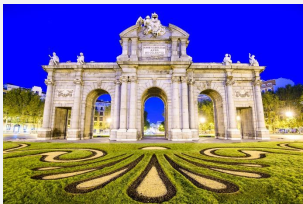
Μαδρίτη, Πουέρτα ντε Αλκαλά