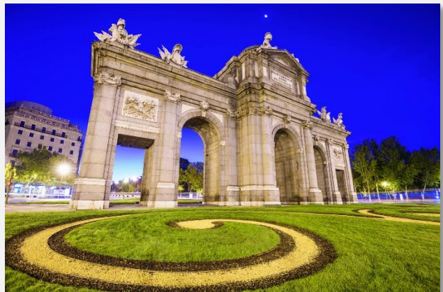
Puerta de Alcalá, Μαδρίτη