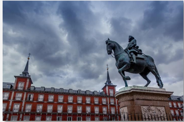
Plaza Mayor, Μαδρίτη

Για τη σημερινή ημέρα έχουμε προγραμματίσει την περιπατητική ξενάγηση στο ιστορικό κέντρο της πόλης και τα σοκάκια της, στην Πλάθα Μαγιόρ, στην Πλάθα ντ' Εσπάνια κ.ά. Θα αναχωρήσουμε με τον αρχηγό μας για να επισκεφθούμε το Μουσείο Πράδο , σημαντικό μουσείο και μεγάλη πινακοθήκη της Ισπανίας (η είσοδος δεν περιλαμβάνεται), όπου θα δούμε εντυπωσιακές συλλογές διάσημων ζωγράφων (Βελάσκεθ, Ελ Γκρέκο, Γκόγια, Ριμπέιρα, Μουρίλο, Τισιάνο, Ραφαήλ κ.α.) – ένα μοναδικό ταξίδι «στο χρόνο και στο χρώμα». Επίσης, μπορείτε να επισκεφθείτε το Παλάτιο Ρεάλ, το ανάκτορο των