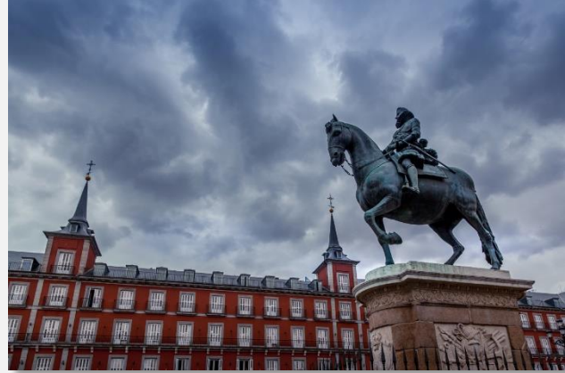
Plaza Mayor, Μαδρίτη

Για τη σημερινή ημέρα έχουμε προγραμματίσει την περιπατητική ξενάγηση στο ιστορικό κέντρο της πόλης και τα σοκάκια της, στην Πλάθα Μαγιόρ, στην Πλάθα ν' Εσπάνια κ.ά. Θα αναχωρήσουμε με τον αρχηγό μας για να επισκεφθούμε το Μουσείο Πράδο , σημαντικό μουσείο και μεγάλη πινακοθήκη της Ισπανίας (η είσοδος δεν περιλαμβάνεται), όπου θα δούμε εντυπωσιακές συλλογές διάσημων ζωγράφων (Βελάσκεθ, Ελ Γκρέκο, Γκόγια, Ριμπείρα, Μουρίλο, Τιτσιάνο, Ραφαήλ κ.α.) – ένα μοναδικό ταξίδι «στο χρόνο και στο χρώμα». Επίσης, μπορείτε να επισκεφθείτε το Παλάτιο Ρεάλ, το ανάκτορο των