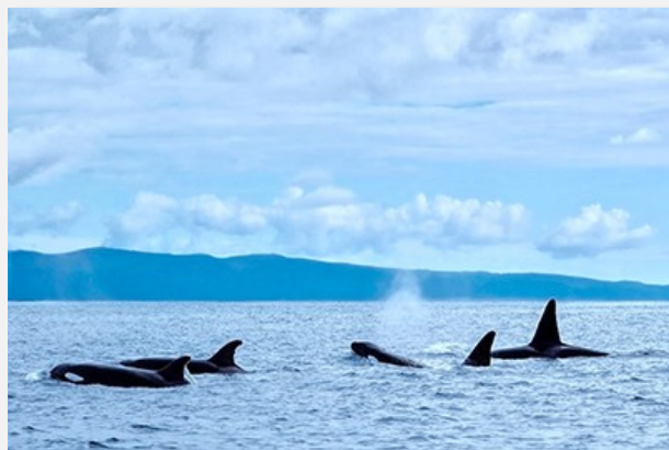
Dolphin watching στις Αζόρες

Αναχώρηση για την περιήγησή μας στη Lagoa do Fogo , τη «λίμνη της φωτιάς» δηλαδή, όνομα διόλου τυχαίο. Είναι η δεύτερη μεγαλύτερη ηφαιστειακή λίμνη και εκείνη με το μεγαλύτερο υψόμετρο (575 μ.) στο νησί, περιτριγυρισμένη στο μεγαλύτερο μέρος της από πλαγιές με μεγάλη κλίση. Επιστρέφοντας σε «αστικό» περιβάλλον, ερχόμαστε στην όμορφη Ριμπέιρα Γκράντε , στο βόρειο τμήμα του νησιού, με έναν εξαιρετικό βοτανικό κήπο και το δημαρχιακό μέγαρο του 17ου αι. Η συνέχεια της διαδρομής προς τα ανατολικά μας επιφυλάσσει μια στάση στο Miradouro de Santa Iria, τοποθεσία όπου θα απολαύσουμε ένα εντυπωσιακό όσο και άγριο τοπίο προς τος πορτογαλικό αρχιπέλαγος. Έπειτα θα επισκεφθούμε το μοναδικό μέρος στην Ευρώπη όπου παράγεται τσάι (εργαστήριο), πριν συνεχίσουμε για το Miradouro Pico do Ferro, από όπου η θέα στη Λίμνη Φούρνας , ακόμη ένα συγκλονιστικό τοπίο που μόνο με εικόνες μπορεί να περιγραφεί. Σημειώστε επίσης πως η περιοχή αυτή φημίζεται και για κάτι ακόμα, την σπεσιαλιτέ των Αζορών «cozido a portuguesa», το διάσημο φαγητό που οι ντόπιοι μαγειρεύουν σε φούρνους που ζεσταίνονται από την έντονη ηφαιστειακή δραστηριότητα! Αν ο χρόνος το επιτρέπει, ίσως έχουμε την ευκαιρία να το δοκιμάσουμε στο χωριό Φούρνας (δεν περιλαμβάνεται). Στον ίδιο οικισμό συναντάμε ακόμη δύο top τοπικά αξιοθέατα, το πάρκο Terra Nostra , μια έκταση 12 εκταρίων με οργιαστική βλάστηση από φτέρες, ορτανσίες και άλλα φυτά, όπως και την πηγή Ροζα Dona Beija, μια φυσική θερμή πηγή με νερό σταθερά στους 30oC