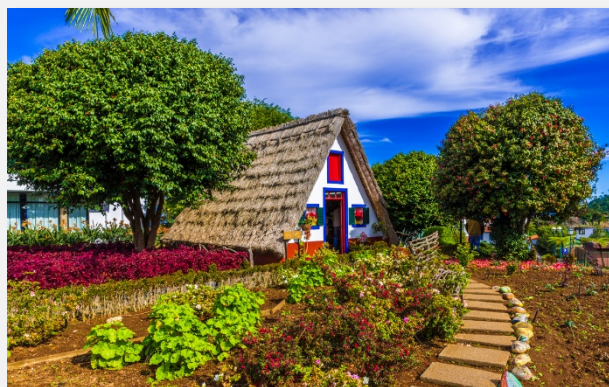
Τα χαρακτηριστικά τριγωνικά σπίτια με τις σχυρένιες στέγες, στο χωριό Σαντάνα, της Μαδέρα