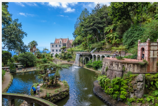
Tropical Monte Palace Garden, Φουντσάλ