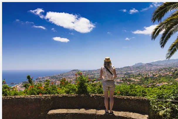
Πανοραμική θέα στη Φουντσάλ