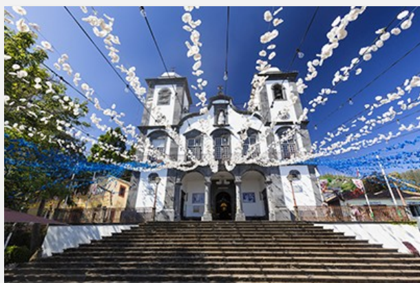
Nossa Senhora do Monte, Φουντσάλ