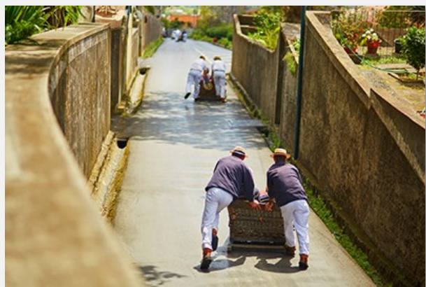
Κατάβαση με toboggan στη Φουντσάλ