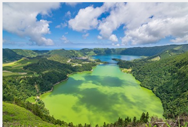
Lagoa das Sete Cidades, όπως φαίνεται από το σημείο θέασης Vista do Rei

Το παραπάνω πρόγραμμα είναι ενδεικτικό. Το τελικό ενημερωτικό αποστέλλεται περίπου 3-5 ημέρες πριν από την εκάστοτε αναχώρηση.