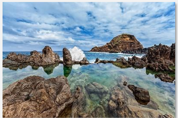
Ηφαιστειακές πισίνες, Πόρτο Μονιζ