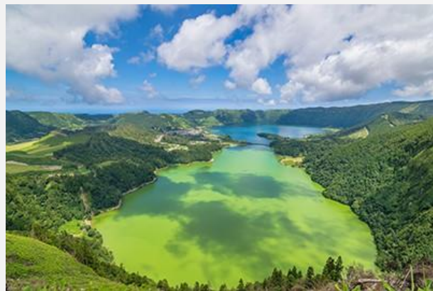
Lagoa das Sete Cidades, όπως φαίνεται από το σημείο θέασης Vista do Rei