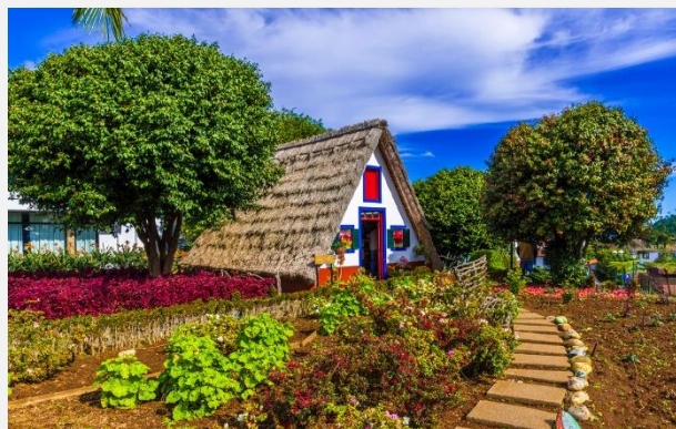
Τα χαρακτηριστικά τριγωνικά σπίτια με τις αχυρένιες στέγες, στο χωριό Σαντάνα, της Μαδέρα