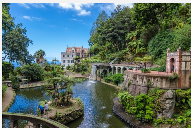
Tropical Monte Palace Garden, Φουντσάλ