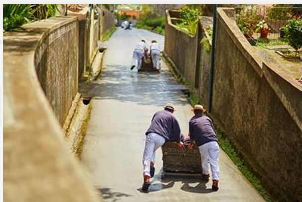
Κατάβαση με toboggan στη Φουντσάλ