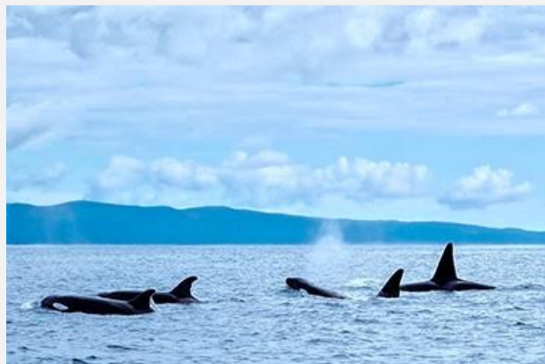
Dolphin watching στις Αζόρες

Αναχώρηση για την περιήγησή μας στη Lagoa do Fogo , τη «λίμνη της φωτιάς» δηλαδή, όνομα διόλου τυχαίο. Είναι η δεύτερη μεγαλύτερη ηφαιστειακή λίμνη και εκείνη με το μεγαλύτερο υψόμετρο (575 μ.) στο νησί, περιτριγυρισμένη στο μεγαλύτερο μέρος της από πλαγιές με μεγάλη κλίση. Επιστρέφοντας σε «αστικό» περιβάλλον, ερχόμαστε στην όμορφη Ριμπέιρα Γκράντε , στο βόρειο τμήμα του νησιού, με έναν εξαιρετικό βοτανικό κήπο και το δημαρχιακό μέγαρο του 17ου αι. Η συνέχεια της διαδρομής προς τα ανατολικά μας επιφυλάσσει μια στάση στο Miradouro de Santa Iria, τοποθεσία όπου θα απολαύσουμε ένα εντυπωσιακό όσο και άγριο τοπίο προς τος πορτογαλικό αρχιπέλαγος. Έπειτα θα επισκεφθούμε το μοναδικό μέρος στην Ευρώπη όπου παράγεται τσάι (εργαστήριο), πριν συνεχίσουμε για το Miradouro Pico do Ferro, από όπου η θέα στη Λίμνη Φούρνας , ακόμη ένα συγκλονιστικό τοπίο που μόνο με εικόνες μπορεί να περιγραφεί. Σημειώστε επίσης πως η περιοχή αυτή φημίζεται και για κάτι ακόμα, την σπεσιαλιτέ των Αζορών «cozido a portuguesa», το διάσημο φαγητό που οι ντόπιοι μαγειρεύουν σε φούρνους που ζεσταίνονται από την έντονη ηφαιστειακή δραστηριότητα! Αν ο χρόνος το επιτρέπει, ίσως έχουμε την ευκαιρία να το δοκιμάσουμε στο χωριό Φούρνας (δεν περιλαμβάνεται). Στον ίδιο οικισμό συναντάμε ακόμη δύο top τοπικά αξιοθέατα, το πάρκο Terra Nostra , μια έκταση 12 εκταρίων με οργιαστική βλάστηση από φτέρες, ορτανσίες και άλλα φυτά, όπως και την πηγή Ροζα Dona Beija, μια φυσική θερμή πηγή με νερό σταθερά στους 30οC