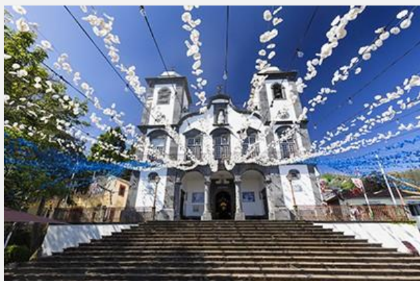
Nossa Senhora do Monte, Φουντσάλ