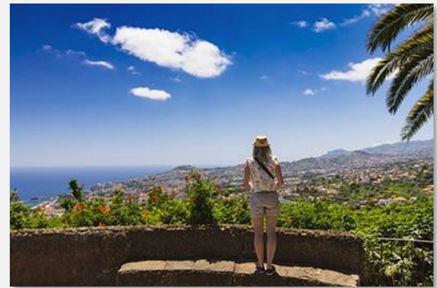
Πανοραμική θέα στη Φουντσάλ