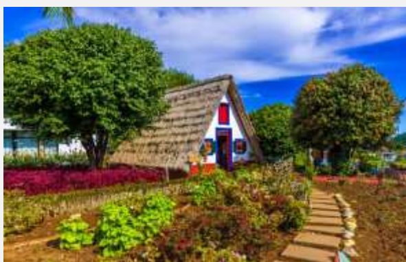
Τα χαρακτηριστικά τριγωνικά σπίτια με τις αχυρένιες στέγες, στο χωριό Σαντάνα, της Μαδέρα