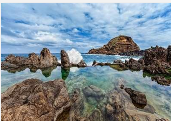
Ηφαιστειακές πισίνες, ΠόντοΜονίς