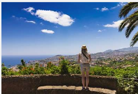
Πανοραμική θέα στη Φουντσάλ