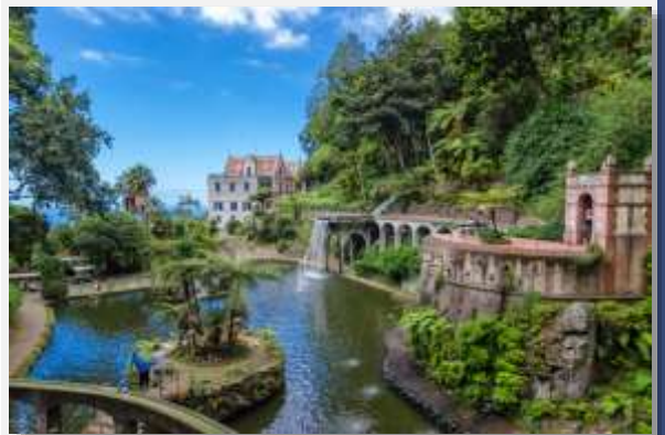
Tropical Monte Palace Garden, Φουντσάλ