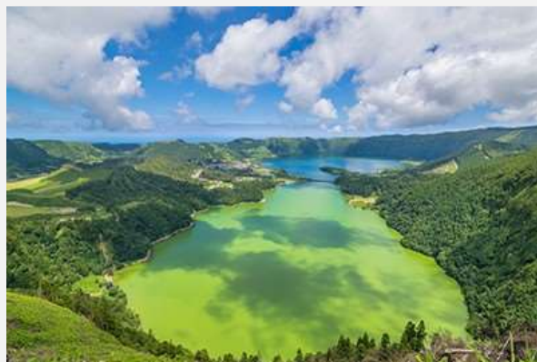
LagoadasSeteCidades, όπως φαίνεται από το σημείο θέασης VistadoRei

Η λίμνη SeteCidades (Επτά Πόλεις) είναι η πιο αναγνωρίσιμη καρτ-ποστάλ των Αζορών! Δεν θα μπορούσαμε λοιπόν να μην αφιερώσουμε αρκετό χρόνο ώστε να επισκεφθούμε αυτό