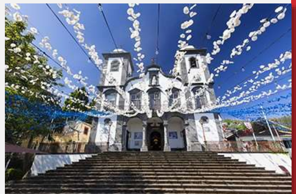
Nossa Senhora do Monte, Φουντσάλ