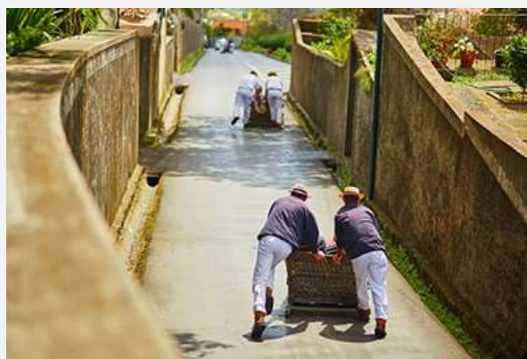
Κατάβαση με toboggan στη Φουντσάλ