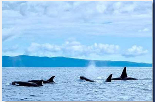
Dolphin watching στις Αζόρες

Μετά το πρωινό, μεταβαίνουμε στο αεροδρόμιο, από όπου θα πετάξουμε για τις Αζόρες και το νησί του Σάο Μιγκέλ , το μεγαλύτερο του συμπλέγματος των Αζορών. Οι Πορτογάλοι τα λένε «τα νησιά των γυπών», και σίγουρα η αύρα των νησιών αποπνέει κάτι το περιπετειώδες που δύσκολα περιγράφεται με λέξεις. Αφού φτάσουμε στο Σάο Μιγκέλ,