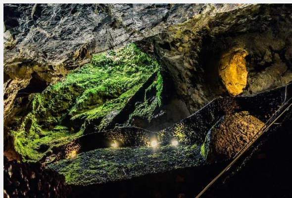
Αλγκάρ ντο Καρβάο