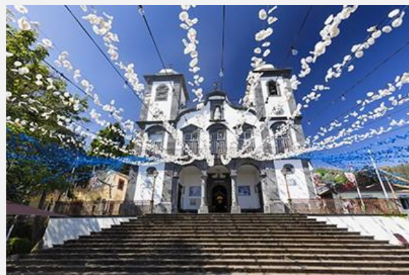
Nossa Senhora do Monte, Φουντσάλ