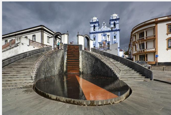
Άγκρα ντο Εροΐσμου

Αργότερα επιστρέφουμε στην Πόντα Ντελγκάδα από όπου με νέα πτήση μεταβαίνουμε στον επόμενο σταθμό του ταξιδιού μας, το νησί της Μαδέρα . Άφιξη στο αεροδρόμιο Cristiano Ronaldo, μετάβαση στο