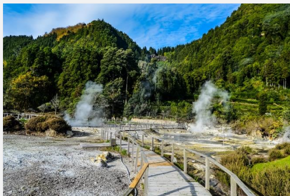
Θερμές πηγές - Φούρνας

Αφού ξεκουραστούμε θα πάμε να γνωρίσουμε την πόλη. Η Άγκρα ντο Εροϊσμου έχει χαρακτηριστεί ολόκληρη Μνημείο της UNESCO από το 1983, με το