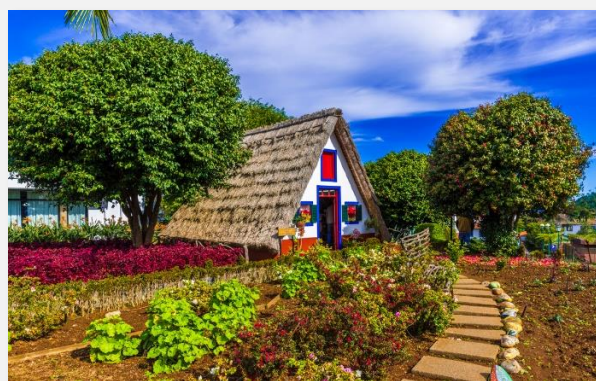
Τα χαρακτηριστικά τριγωνικά σπίτια με τις αχυρένιες στέγες, στο χωριό Σαντάνα, της Μαδέρα