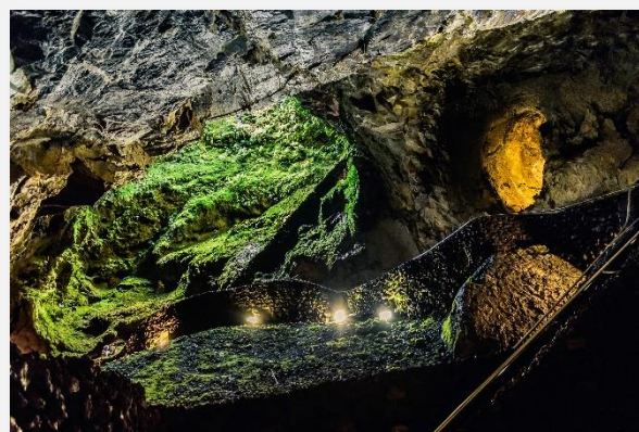
Αλγκάρ ντο Καρβάο