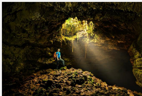
Σπηλιές Αλγκάρ ντο Καρβάο