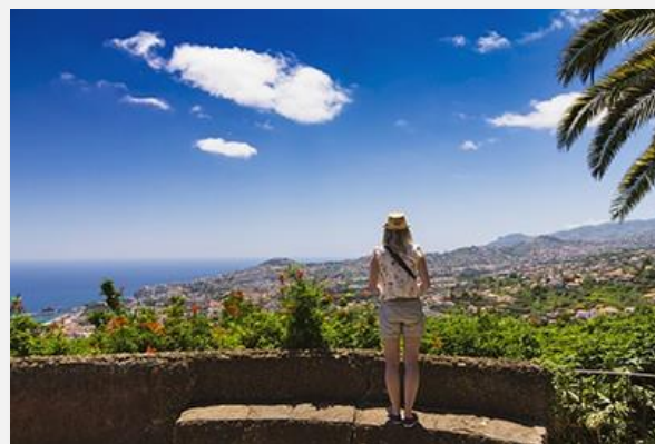
Πανοραμική θέα στη Φουντσάλ