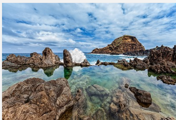
Ηφαιστειακές πισίνες, Πόρτο Μονιζ