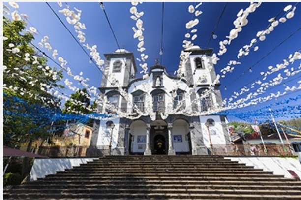
Nossa Senhora do Monte, Φουντσάλ

Παρότι σήμερα θα κινηθούμε κοντά στην πόλη της Φουντσάλ, θα δούμε πολλές εναλλαγές τοπίου. Θα ξεκινήσουμε από το viewpoint στο Pico dos Barcelos (350 μ. υψόμετρο), ακριβώς πάνω από τη Φουντσάλ, απολαμβάνοντας σουπερ θέα στην πόλη και στον κόλπο της Φουντσάλ. Κατόπιν, βγαίνοντας από την πόλη, θα επισκεφθούμε ένα εργοστάσιο ζαχαροπλαστικής για να δούμε από κοντά πώς παρασκευάζεται το τοπικό «κέικ μελιού», ένα από τα πιο αγαπημένα χριστουγεννιάτικα γλυκίσματα της Μαδέρα. Μετά τη γλυκιά αυτή εμπειρία, ανεβαίνουμε μέχρι το Eira do Serrado, τοποθεσία στα 1.094 μ. με εντυπωσιακή πανοραμική θέα στις υψηλότερες κορυφές