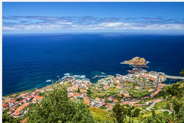
Πόρτο Μονιζ, Μαδέρα

Σήμερα αφήνουμε πίσω μας την πρωτεύουσα και ξεκινάμε για να εξερευνήσουμε αυτό το καταπράσινο νησί. Με αφετηρία μας λοιπόν τη Φουντσάλ κινούμαστε προς τα δυτικά με πρώτο μας σταθμό το ψαροχώρι Κάμαρα ντα Λόμπος , όπου δεσπόζει το ψηλότερο ακρωτήριο της Ευρώπης (και δεύτερο ψηλότερο στον κόσμο), το Cabo Girao , που φτάνει τα 580 μ. πάνω από τη θάλασσα! Συνεχίζουμε για τη Ριμπέιρα Μπράβα , όπου θα κάνουμε μια στάση για να δούμε την εκκλησία του Sao Bento με τις εντυπωσιακές αιογραφίες. Παραμένοντας στη νότια ακτογραμμή της Μαδέρα φτάνουμε στο Πόντα ντο Σολ από όπου ανηφορίζουμε για το οροπέδιο Πολ ντα Σέρρα· η γεωμορφία εδώ θυμίζει έντονα τα... Χάιλαντς της Σκωτίας! Επόμενος σταθμός μας το Πόρτο Μονιζ , με τις φυσικές ηφαιστειακές πισίνες δίπλα στη θάλασσα. Στο Πόρτο Μονιζ θα έχουμε χρόνο για φαγητό, για να δοκιμάσουμε την τοπική γαστρονομία, πριν συνεχίσουμε τη διαδρομή μας για το Σαο Βισέντε από όπου χαράζουμε κατεύθυνση προς το πέρασμα της Ενκουεάδα, στα 1.007μ. υψόμετρο! Επιστροφή στην Φουντσάλ. Διανυκτέρευση.