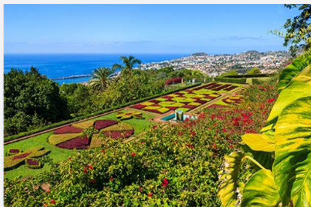
Tropical Monte Palace Garden, Φουντσάλ