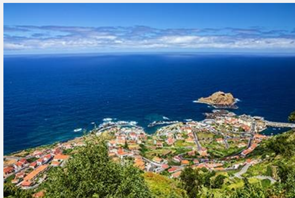
Πόρτο Μονιζ, Μαδέρα

Σήμερα αφήνουμε πίσω μας την πρωτεύουσα και ξεκινάμε για να εξερευνήσουμε αυτό το καταπράσινο νησί. Με αφετηρία μας λοιπόν τη Φουντσάλ κινούμαστε προς τα δυτικά με πρώτο μας σταθμό το ψαροχώρι Κάμαρα ντα Λόμπος , όπου δεσπόζει το ψηλότερο ακρωτήριο της Ευρώπης (και δεύτερο ψηλότερο στον κόσμο), το Cabo Girao , που φτάνει τα 580 μ. πάνω από τη θάλασσα! Συνεχίζουμε για τη Ριμπέιρα Μπράβα , όπου θα κάνουμε μια στάση για να δούμε την εκκλησία του Sao Bento με τις εντυπωσιακές αγιογραφίες. Παραμένοντας στη νότια ακτογραμμή της Μαδέρα φτάνουμε στο Πόντα ντο Σολ από όπου ανηφορίζουμε για το οροπέδιο Πολ ντα Σέρρα· η γεωμορφία εδώ θυμίζει έντονα τα... Χάιλαντς της Σκωτίας! Επόμενος σταθμός μας το Πόρτο Μονιζ , με τις φυσικές ηφαιστειακές πισίνες δίπλα στη θάλασσα. Στο Πόρτο Μονιζ θα έχουμε χρόνο για φαγητό, για να δοκιμάσουμε την τοπική γαστρονομία, πριν συνεχίσουμε τη διαδρομή μας για το Σαο Βισέντε από όπου χαράζουμε κατεύθυνση προς το πέρασμα της Ενκουμέαδα, στα 1.007μ. υψόμετρο! Επιστροφή στην Φουντσάλ. Διανυκτέρευση.