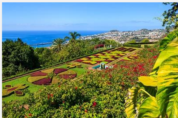
Tropical Monte Palace Garden, Φουντσάλ