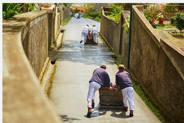
Κατάβαση με toboggan στη Φουντσάλ