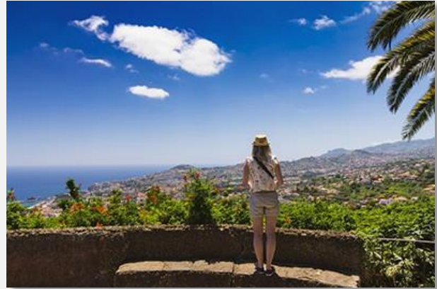
Πανοραμική θέα στη Φουντσάλ

Αναχώρηση από το ξενοδοχείο μας για το αεροδρόμιο από όπου θα πετάξουμε, μέσω ενδιάμεσου σταθμού, για την επιστροφή μας στην Ελλάδα.