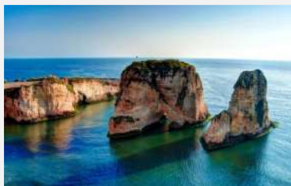
Η σπηλιά των σπουργιτιών