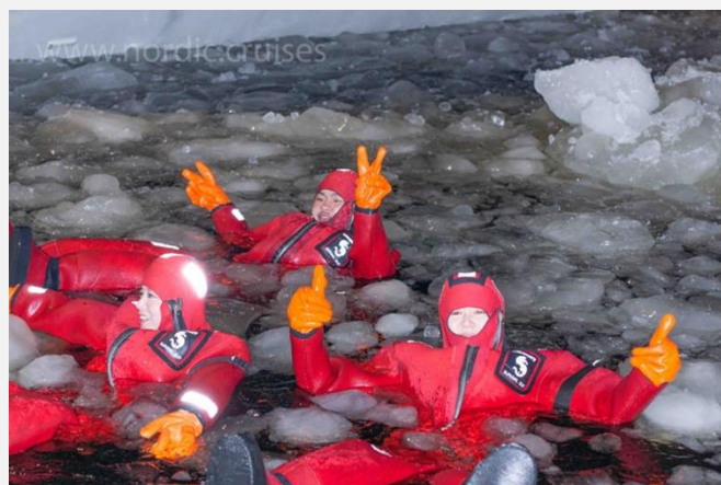
το λέει η καρδιά σας;

Το παραπάνω πρόγραμμα είναι ενδεικτικό. Το τελικό ενημερωτικό αποστέλλεται περίπου 3-5 ημέρες πριν από την εκάστοτε αναχώρηση.