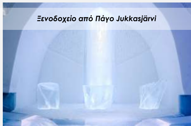
Ξενοδοχείο από Πάγο Jukkasjärvi

Μεταφορά και τακτοποίηση στο ξενοδοχείο μας. Το βράδυ μάς περιμένει παραδοσιακό σουηδικό δείπνο σε τοπικό εστιατόριο. Διανυκτέρευση.