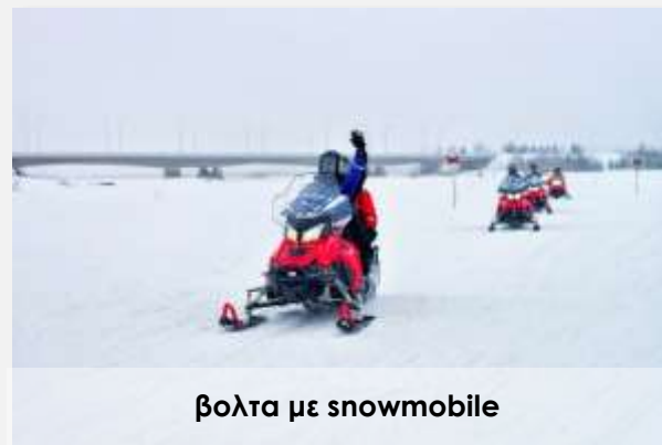
βολτα με snowmobile