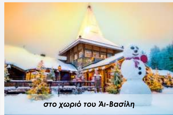
στο χωριό του Άι-Βασίλη