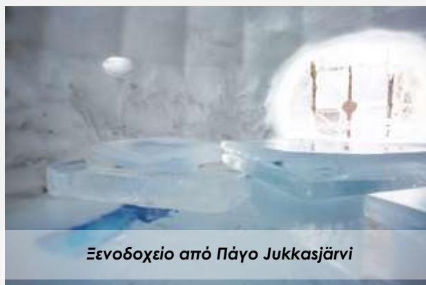
Ξενοδοχείο από Πάγο Jukkasjärvi