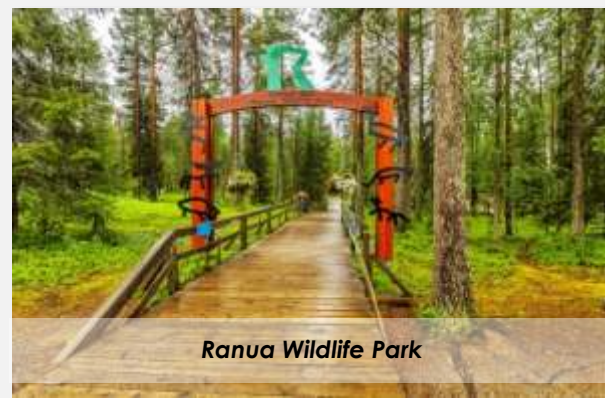
Ranua Wildlife Park