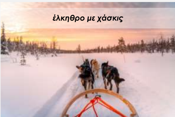
έλκηθρο με χάσκις