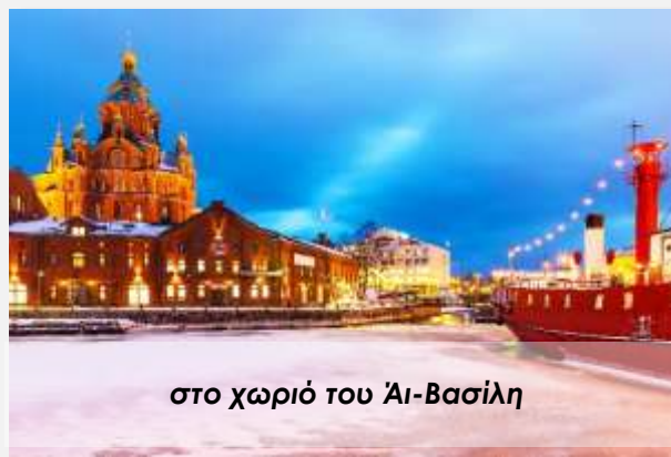
στο χωριό του Άι-Βασίλη