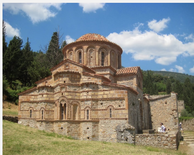
Βυζαντινός ναός Αγίας Σοφίας, Μυστράς