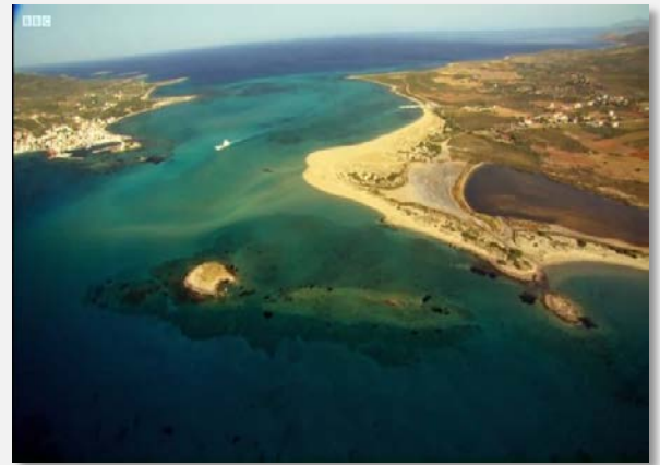
Εναέρια άποψη από το Παυλοπέτρι