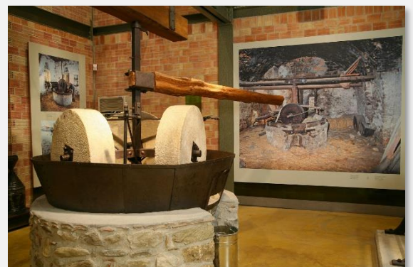
Μουσείο Ελιάς και Ελληνικού Λαδιού