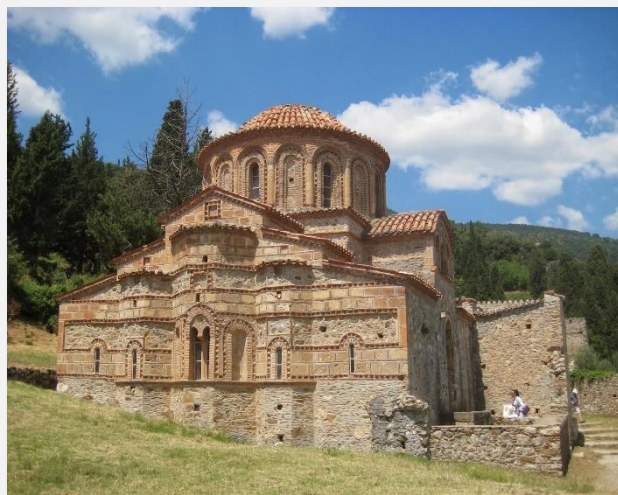
Βυζαντινός ναός Αγίας Σοφίας, Μυστράς