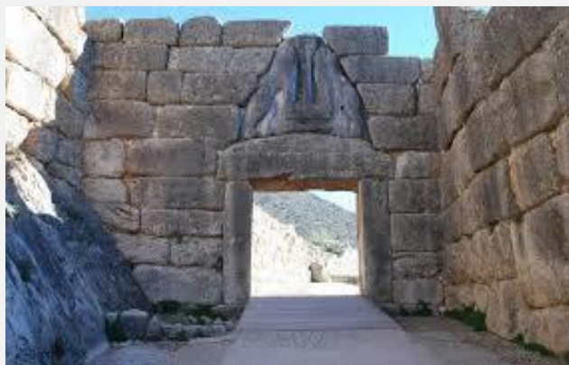
Πύλη των Λεόντων, Μυκήνες

Η Μονεμβασιά του Γιάννη Ρίτσου ,το «Γιβραλτάρ της Ελλάδας» μας περιμένει. Το ίδιο και το σπίτι και ο τάφος του. Το λέει και το όνομά της: Έχει μία «μόνη εμβασία» (είσοδο) μετά από την αποκοπή της από την υπόλοιπη Πελοπόννησο, από τον ισχυρό σεισμό του 375μ.χ! Μέσα στα μεσαιωνικά τείχη της Μονεμβασιάς βρίσκεται μια από τις πιο καλοδιατηρημένες και ζωντανές καστροπολιτείες