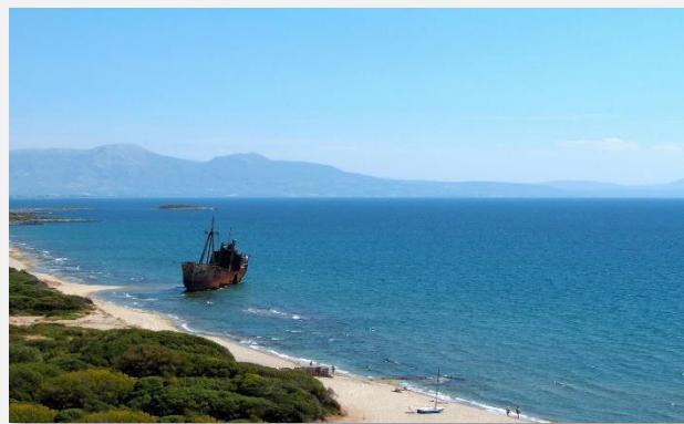
Ναυάγιο στο Βαλτάκι, Γύθειο