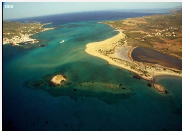
Εναέρια άποψη από το Παυλοπέτρι