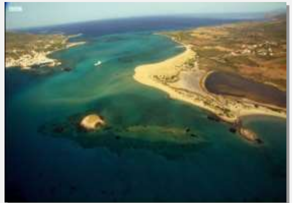
Εναέρια άποψη από το Παυλοπέτρι