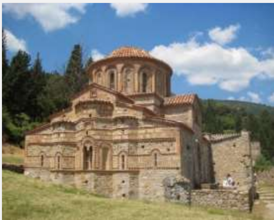
Βυζαντινός ναός Αγίας Σοφίας, Μυστράς