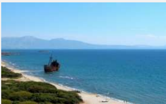
Ναυάγιο στο Βαλτάκι, Γύθειο