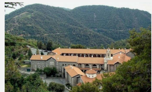
Ιερά Μονή Κύκκου