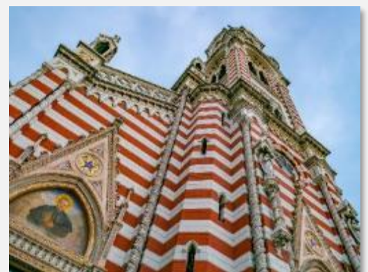
Χαρακτηριστικό δείγμα εκκλησιαστικής αρχιτεκτονικής στην Μπογκοτά