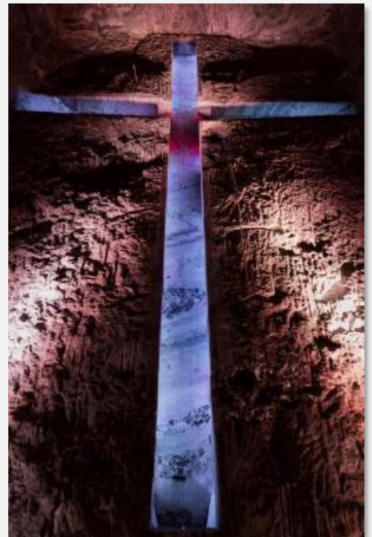
Ο πελώριος σταυρός στα αλατωρυχεία της Ζιπακίρα