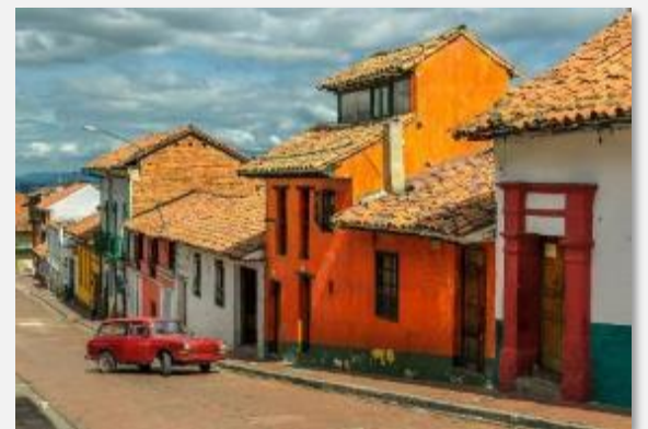
Έντονο το παραδοσιακό χρώμα στην Καντελαρία