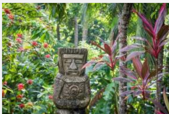
Δείγμα προκολομβιανού πολιτισμού στη ζούγκλα της Ταϊρόνα