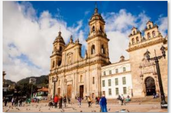
Ο καθεδρικός ναός στην πλατεία Μπολίβαρ

Θα ξεκινήσουμε την ξενάγησή μας από την πιο διάσημη αγορά της πόλης, την λεγόμενη Paloquemao. Νωρίς το πρωί η αγορά είναι γεμάτη χρώματα και αρώματα καθώς τα φρεσκοκομμένα ευδισαστά λουλούδια στην αγορά των λουλουδιών