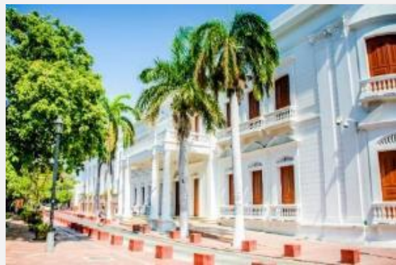
Αποικιακή αρχιτεκτονική στη Σάντα Μάρτα

Κατ' αρχάς πρέπει να πούμε ότι Ταϊρόνα ονομάζονταν οι ιθαγενείς που κατοικούσαν την περιοχή της Σάντα Μάρτα και στο πάρκο μέχρι που καταπάτησαν τα εδάφη οι κονκισταδόρες τον 16ο αιώνα και τους εξολόθρευσαν. Ελάχιστα γνωρίζουμε σήμερα γι' αυτούς, ωστόσο τα αρχαιολογικά ευρήματα δείχνουν πως είχαν αναπτύξει έναν προηγμένο πολιτισμό για την εποχή τους. Η αρχαία Σάντα Μάρτα είναι κατασκευασμένη από πέτρα, με πολλούς πέτρινους υπόγειους διαδρόμους. Διέθετε προηγμένο σύστημα ύδρευσης και εκτεταμένες εμπορικές εγκαταστάσεις. Οι Ταϊρόνα ήταν καλλιεργητές ανανά και γιούκα και έμποροι. Εμπορεύονταν δια ξηράς και δια θαλάσσης τα