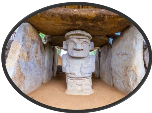
Στο Δάσος με τα Αγάλματα, στο Σαν Αγκουστίν.