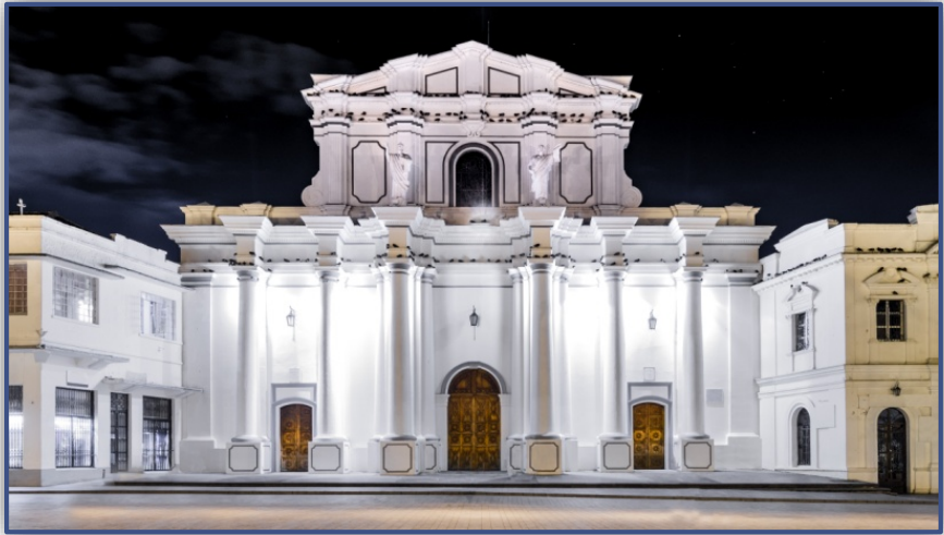
Ο Καθεδρικός της Ποταγιάς στον οποίο εκτιθόταν ως τάμα από το 1599 έως το 1936 η κορώνα των Άνδεων

για λόγους ασφαλείας από ειδική επιτροπή προυχόντων της πόλης.