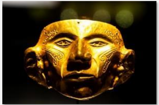
Στο Μουσείο Χρυσού , Μπογκοτά

Σειρά έχει το Μουσείο του Χρυσού όπου θα δούμε τη μόνιμη συλλογή που απαρτίζεται από 32.000 εκθέματα και 20.000 πολύτιμους και ημιπολύτιμους λίθους! Ας μην ξεχνάμε ότι τα εδάφη της Κολομβίας είναι εξαιρετικά πλούσια σε κοιτάσματα πολύτιμων μετάλλων και πετρωδιών, ιδιαίτερως σμαραγδιών... Στο μουσείο αυτό