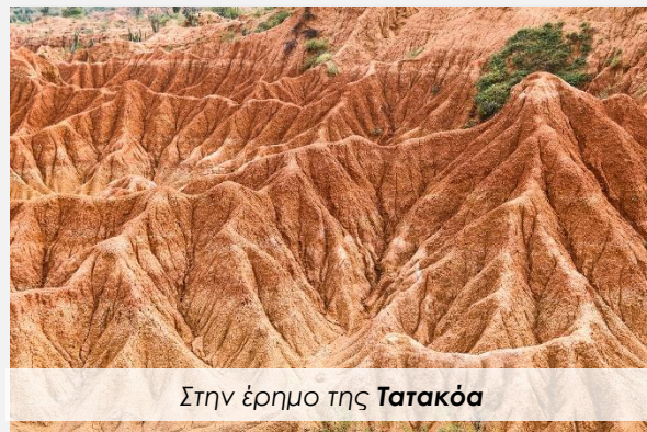
Στην έρημο της Τατακόα