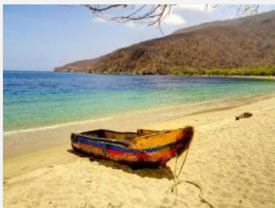
Χρυσ αφένια αμμουδιά στο Πάρκο Ταϊρόνα