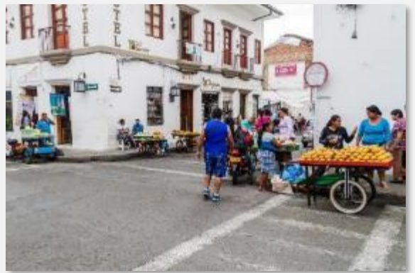
Στους δρόμους της Ποπαγιάν

Οι λατινοαμερικάνοι τιμούν τη Σάντα Μάρτα και για έναν ακόμα λόγο, καθώς εδώ πέθανε ο εθνικός ήρωας-απελευθερωτής της Λατινικής Αμερικής, ο Σιμόν Μπολίβαρ. Η κατοικία του, λίγο έξω από την πόλη, με την