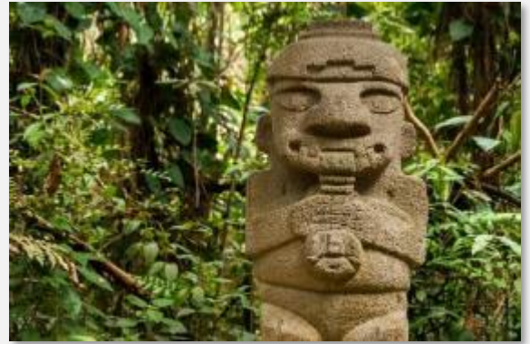
Στον αρχαιολογικό χώρο του Σαν Αγκουστίν

Πρωινό στο ξενοδοχείο και συνεχίζουμε οδικώς για την ιστορική πόλη της Ποπαγιάν . Με την άφιξή μας ξεκινάμε την ξενάγησή μας στο ιστορικό κέντρο της πόλης. Εκεί θα δούμε την εντυπωσιακή μπαρόκ αποικιακή αρχιτεκτονική σε όλο της το μεγαλείο. Η Ποπαγιάν ονομάζεται και Λευκή Πόλη, λόγω των λευκών κτιρίων