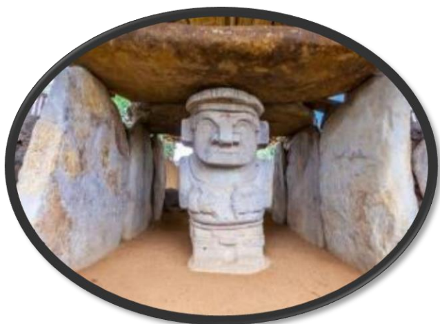
Στο Δάσος με τα Αγάλματα, στο Σαν Αγκουστίν.