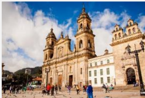
Ο καθεδρικός ναός στην πλατεία Μπολίβαρ

Αμέσως λοιπόν μετά το πρωινό στο ξενοδοχείο μας θα ξεκινήσουμε για μία μεγάλη ξενάγηση στο ιστορικό