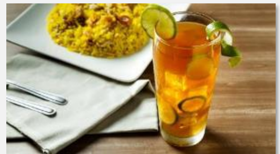
Ρόφημα από πανέλα