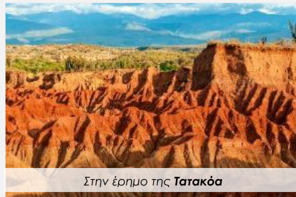
Στην έρημο της Τατακόα