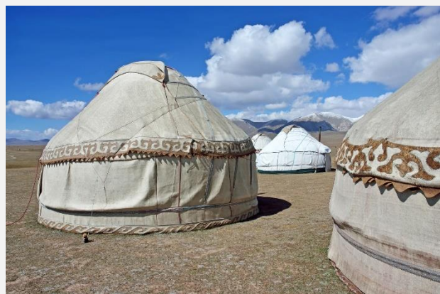
Γιούρτες στη λίμνη Σον Κουλ