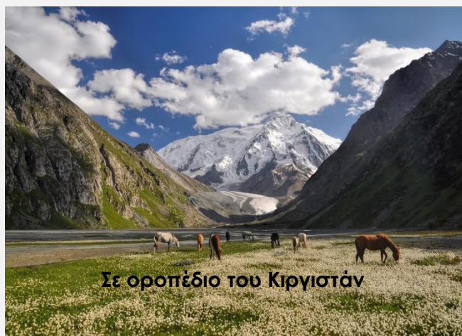
Σε οροπέδιο του Κιργιστάν