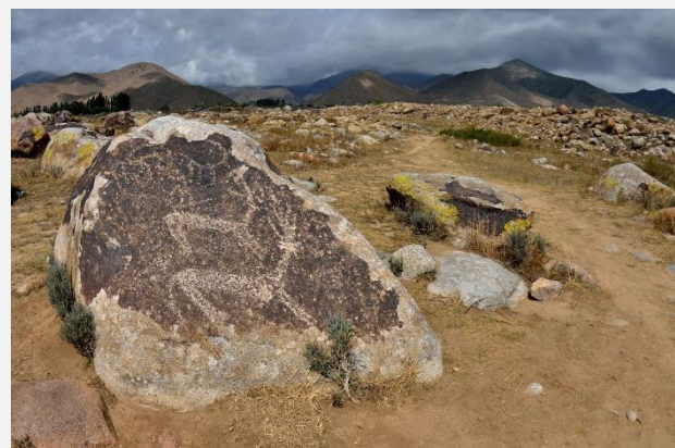
Πετρογραφίες στην Ισίκ Κουλ