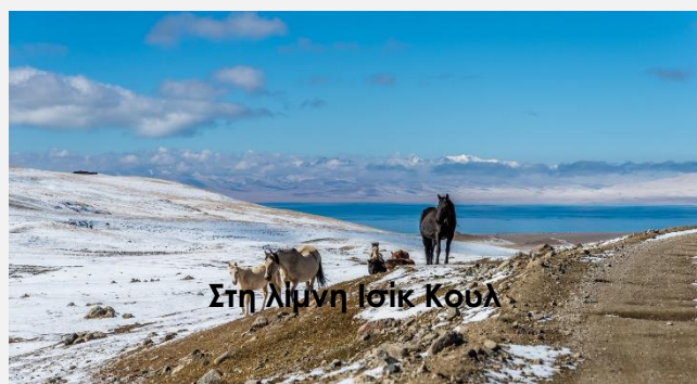
Στη λίμνη Ισίκ Κούλ