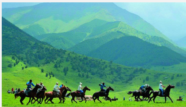
Αγώνες με άλογα στη λίμνη Σον Κουλ