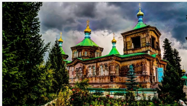
Ξύλινη ορθόδοξη εκκλησία στο Καρακόλ

Το πρωί μάς περιμένει ακόμα μια όμορφη βαρκάδα στη λίμνη Ισίκ Κουλ, ενώ στη συνέχεια θα μεταβούμε στη γειτονική λίμνη Σον-Κουλ. Καθ' οδόν, ωστόσο, θα κάνουμε μια στάση στην πόλη Κοχκόρ, όπου θα μπούμε σε κιργέζικο σπίτι και θα γνωρίσουμε τη μοναδική φιλοξενία μιας οικογένειας Κιργιζών. Θα δούμε, επίσης, το τοπικό μουσείο, ενώ θα παρατηρήσουμε, συμμετέχοντας κιόλας, ύφανση των περίφημων τοπικών χαλιών! Μετάβαση στην περιοχή με τις γιούρτες, όπου και θα διανυκτερεύσουμε.