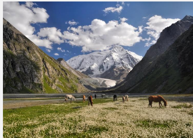
Σε οροπέδιο του Κιργιστάν