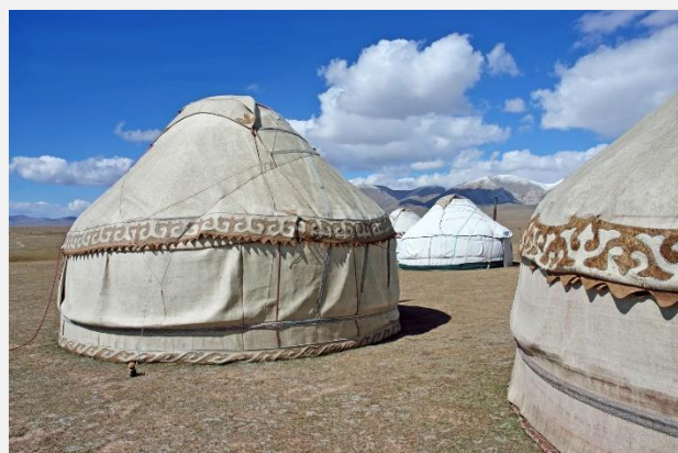
Γιούρτες στη λίμνη Σον Κουλ