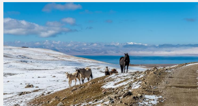
Στη λίμνη Ισίκ Κουλ