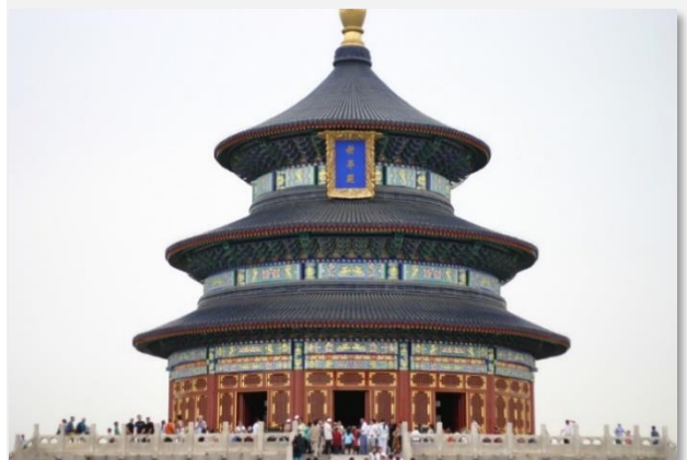
Ναός του Ουρανού