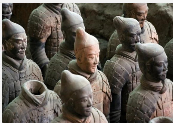
6.000 πήλινοι στρατιώτες, Ξιαν