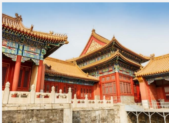
Απαγορευμένη Πόλη, Πεκίνο

Σήμερα το πρωί θα θαυμάσουμε τους σταλακτίτες και τους σταλαγμίτες στο Ασημένιο Σπήλαιο. Είναι το μεγαλύτερο ασβεστολιθικό σπήλαιο στην περιοχή