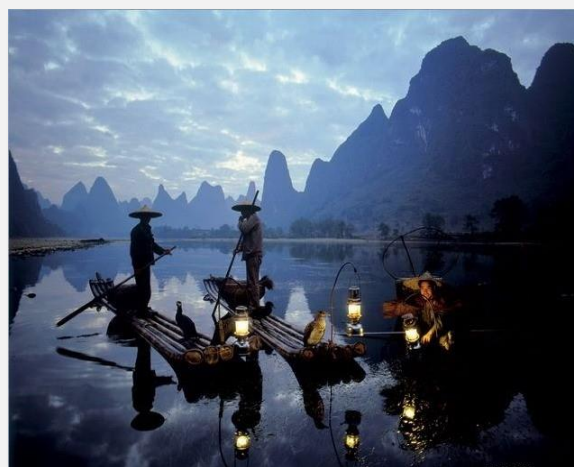
Στον ποταμό Λι Ζιανγκ