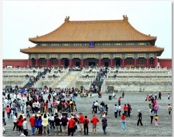
Απαγορευμένη Πόλη, Πεκίνο