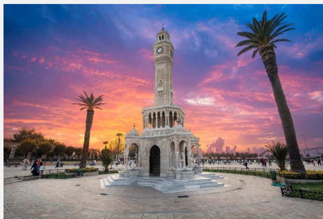
Ο πύργος του Ρολογιού, στη Σμύρνη

Το παραπάνω πρόγραμμα είναι ενδεικτικό. Το τελικό ενημερωτικό αποστέλλεται περίπου 3-5 ημέρες πριν από την εκάστοτε αναχώρηση.