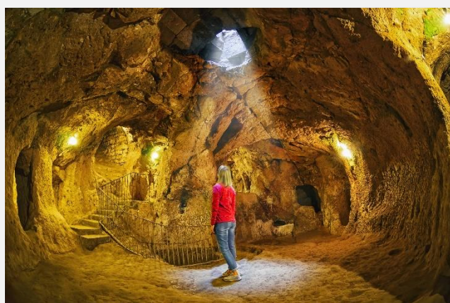
Στην υπόγεια πολιτεία της Μαλακοπής