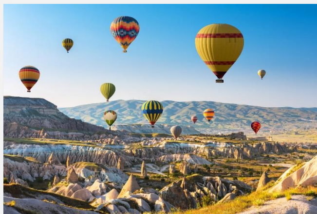
Βόλτα με τα αερόστατα

Εντός των δύο επομένων ημερών θα εξερευνήσουμε την περιοχή της Καππαδοκίας ξεκινώντας από το Προκόπι (σημερινό Ουργκούπ) που βρίσκεται μέσα σε μια πανέμορφη κοιλάδα γεμάτη φυσικές πυραμίδες. Ο σχηματισμός της κοιλάδας του Προκοπίου συνδέεται με την ηφαιστειακή δραστηριότητα του Αργαίου όρους. Αλλεπάλληλα στρώματα ηφαιστειακού υλικού κάλυψαν τη φυσική λεκάνη, δημιουργώντας μία μοναδική φυσική σύνθεση, που το 1985 χαρακτηρίστηκε από την UNESCO μνημείο φυσικής κληρονομιάς. Σας προτείνουμε να επιβιβαστείτε (προαιρετικά) σε ένα από τα αερόστατα και να θαυμάσετε την ιδιόμορφη και μοναδική θέα από ψηλά. Θα συνεχίσουμε με την Κοιλάδα Γκόρεμε (Κόραμα), στην οποία υπάρχουν περισσότερες από 360 λαξευτές εκκλησίες. Αφού επισκεφθούμε τις εκκλησίες του Μεγάλου Βασιλείου, του Μήλου ή Αρχαγγέλου Μιχαήλ, της Αγίας Βαρβάρας και των Σανδάλων, θα αναχωρήσουμε για την κοιλάδα Πασαμπαλάρ, γνωστή για τα περίφημα τρωγλοδυτικά σπίτια κυριολεκτικά χωμένα στα βράχια. Ακολουθεί η Σινασσός, στην οποία θα επισκεφθούμε την εκκλησία των Αγίων Κωνσταντίνου και Ελένης και θα περπατήσουμε στις παλιές ελληνικές γειτονιές με τα θαυμάσια αρχοντικά τους. Τέλος θα επισκεφθούμε το Ουτσίσαρ, όπου θα ανέβουμε στον πύργο του για μια πανοραμική θέα της Καππαδοκίας. Την 3η ημέρα το βράδυ θα απολαύσουμε ένα θέαμα μοναδικό: Χορό των Δερβίσηδων, που υπό τους ήχους