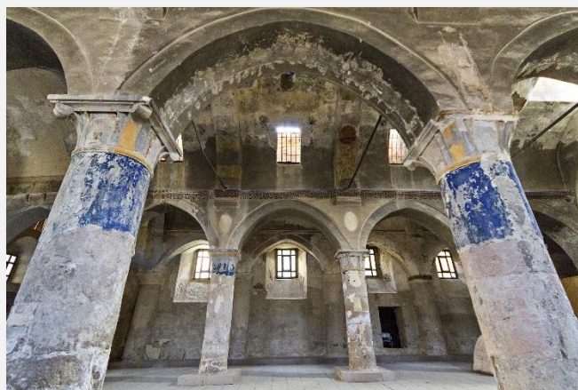
Στην εκκλησία των Αγίων Κωνσταντίνου και Ελένης στη Σινασσό