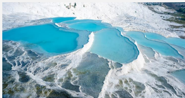
Στις θερμές πηγές του Παμούκαλε