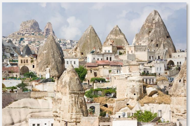
Ηφαιστειογενείς σχηματισμοί στην κοιλάδα Γκόρεμε