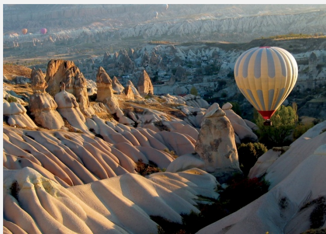
Προκόπι (σημερινό Ουργκούπ)