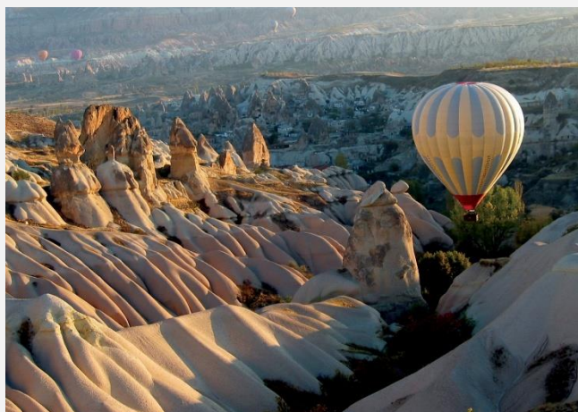
Προκόπι (σημερινό Ουργκούπ)