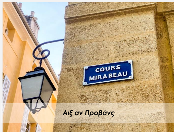
Αιξ αν Προβάνς

Θα δούμε επίσης το Δημαρχείο του 17ου αιώνα και τον πύργο-ρολόι, που κατασκευάστηκε το 1510. Συνεχίσουμε