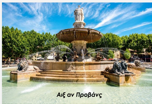
Αιξ αν Προβάνς