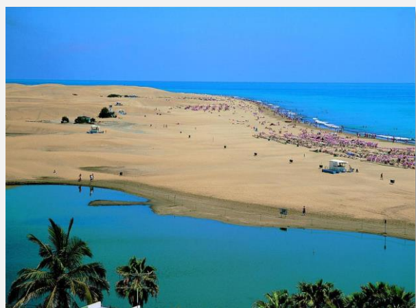
Μασπαλόμας – Γκραν Κανάρια