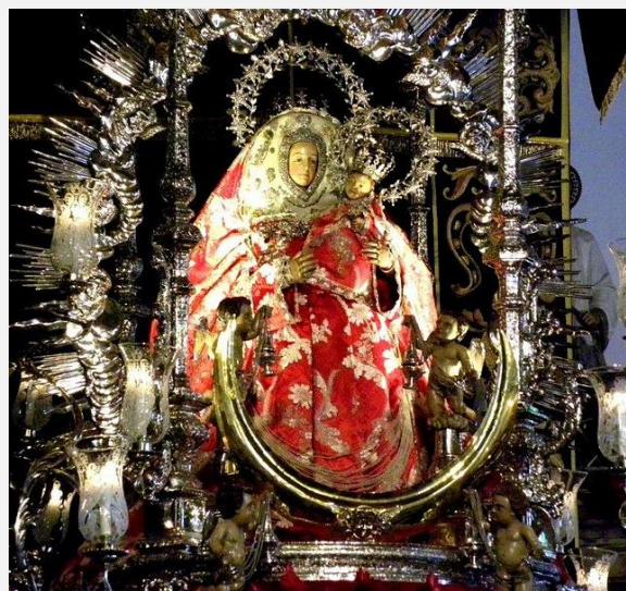
Virgen del Pino – Τερόρ, Γκραν Κανάρια