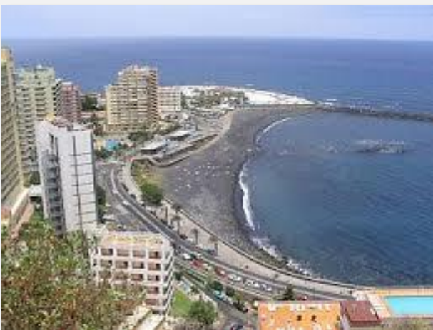
Πουέρτο ντε λα Κρουθ - Τενερίφη