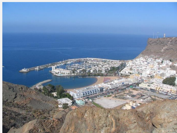
Πουέρτο δε Μογκάν – Γκραν Κανάρια