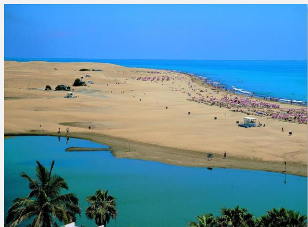
Μασπαλόμας – Γκραν Κανάρια