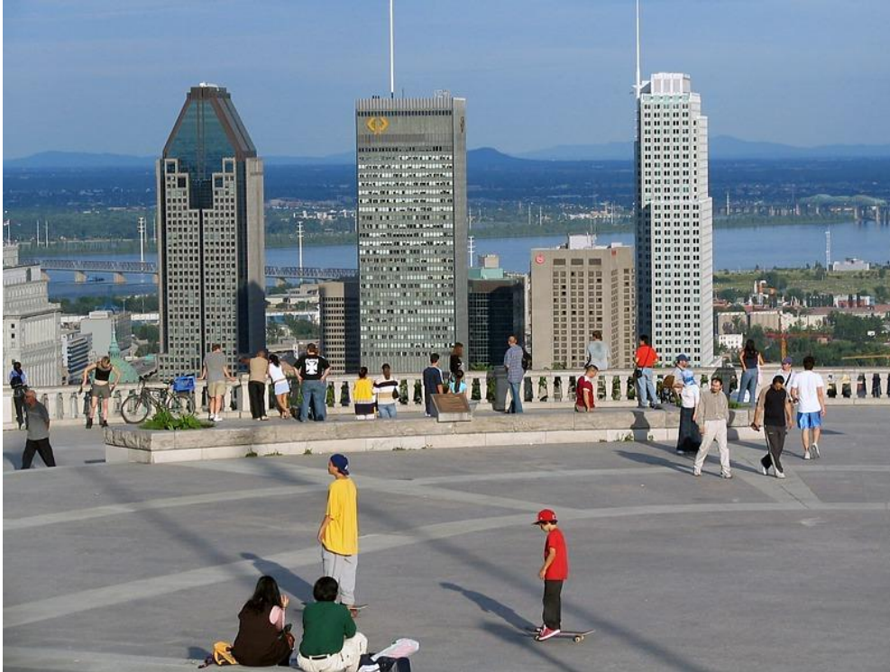
Montreal – Belvedere

Πρωινή ξενάγηση στο Μόντρεαλ, κατά τη διάρκεια της οποίας θα δούμε μεταξύ άλλων το Ολυμπιακό χωριό και το Στάδιο των Ολυμπιακών Αγώνων του 1976, το παλιό λιμάνι, την παλιά συνοικία γύρω από την πλατεία Ζακ Καρτιέ, τον Καθεδρικό Ναό, το Πανεπιστήμιο Mc Gill, το Δημαρχείο, από το μπαλκόνι του οποίου το 1969 ο Ντε Γκωλ εξεστόμισε το περίφημο "Vive le Quebec libre" (Ζήτω το ελεύθερο Κεμπέκ), πυροδοτώντας το διασπαστικό κίνημα του Κεμπέκ και τις τεταμένες σχέσεις με τον Καναδά επί σειρά ετών, το πολυσύχναστο Εμπορικό Κέντρο και τον λόφο Μοντ Ρουαγιάλ. Επιστροφή στο ξενοδοχείο μας. Διανυκτέρευση.