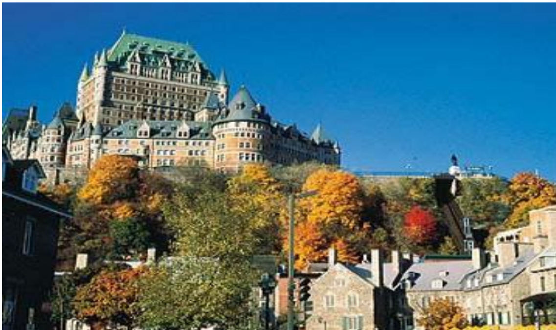
Quebec – Chateau Frontenac