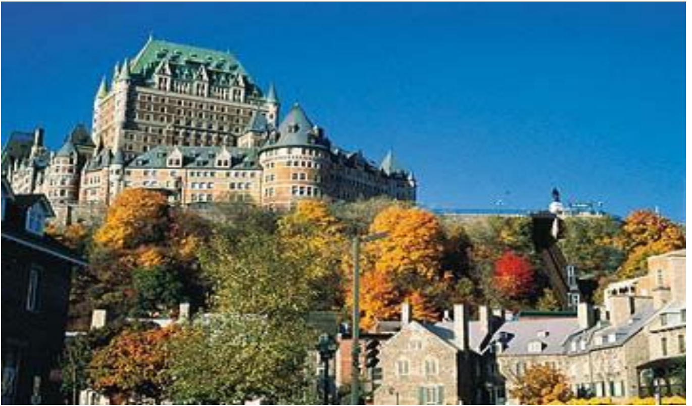
Quebec – Chateau Frontenac