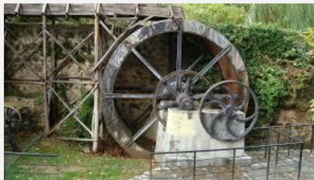
Υπαιθριο Μουσείο Νερού