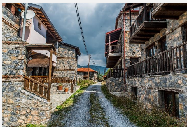
Παλιός Άγιος Αθανάσιος