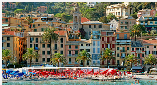
Santa Margherita Ligure

Στη συνέχεια, θα επισκεφθούμε τη συνοικία όπου έζησε ο πατέρας της ιταλικής γλώσσας, ο μεγάλος φιλόσοφος της Αναγέννησης, ο Δάντης Αλιγκέρι. Δεν θα παραλείψουμε βεβαίως να περάσουμε από την περίφημη Πιάτσα Ρεπουμπλικα με τα ιστορικά καφέ Gilli και Paszkowski, καθώς και από την περίφημη Αψίδα του Θριάμβου. Στο τέλος της ξενάγησης, σας προτείνουμε να επισκεφθείτε την πιο σημαντική πινακοθήκη της Ιταλίας, την Γκαλερία Ουφίτσι, όπου θα έχετε την ευκαιρία να θαυμάσετε έργα ζωγραφικής Φλωρεντιανών, Βενετσιάνων και Φλαμανδών καλλιτεχνών. Επιστροφή το απόγευμα στο ξενοδοχείο μας. Διανυκτέρευση στη Φλωρεντία.