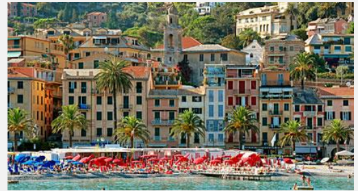
Santa Margherita Ligure

Στη συνέχεια, θα επισκεφθούμε τη συνοικία όπου έζησε ο πατέρας της ιταλικής γλώσσας, ο μεγάλος φιλόσοφος της Αναγέννησης, ο Δάντης Αλιγκέρι. Δεν θα παραλείψουμε βεβαίως να περάσουμε από την περίφημη Πιάτσα Ρεπουμπλικα με τα ιστορικά καφέ Gilli και Paszkowski, καθώς και από την περίφημη Αψίδα του Θριάμβου. Στο τέλος της ξενάγησης, σας προτείνουμε να επισκεφθείτε την πιο σημαντική πινακοθήκη της Ιταλίας, την Γκαλερία Ουφίτσι, όπου θα έχετε την ευκαιρία να θαυμάσετε έργα ζωγραφικής Φλωρεντιανών, Βενετσιάνων και Φλαμανδών καλλιτεχνών. Επιστροφή το απόγευμα στο ξενοδοχείο μας. Διανυκτέρευση στη Φλωρεντία.